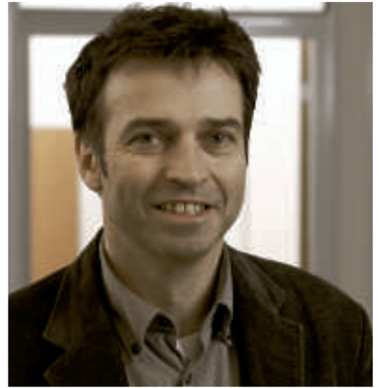
Andreas Ladner ist Politologe an der Uni Lausanne.

Ladner: Viele nutzen Plattformen wie Facebook oder Youtube, um vor allem eine jüngere Wählerschaft für sich zu gewinnen, schliesslich zählt jede Stimme. Man darf heute als Politiker die Rolle diese Netzwerke nicht unterschätzen. Sie beherrschen aber den Wahlkampf in der Schweiz