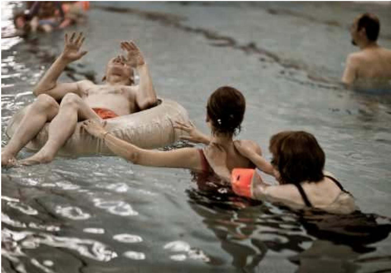
Der Finanzausgleich regelt auch die Aufgabenverteilung - für Behinderte sind die Kantone zuständig.