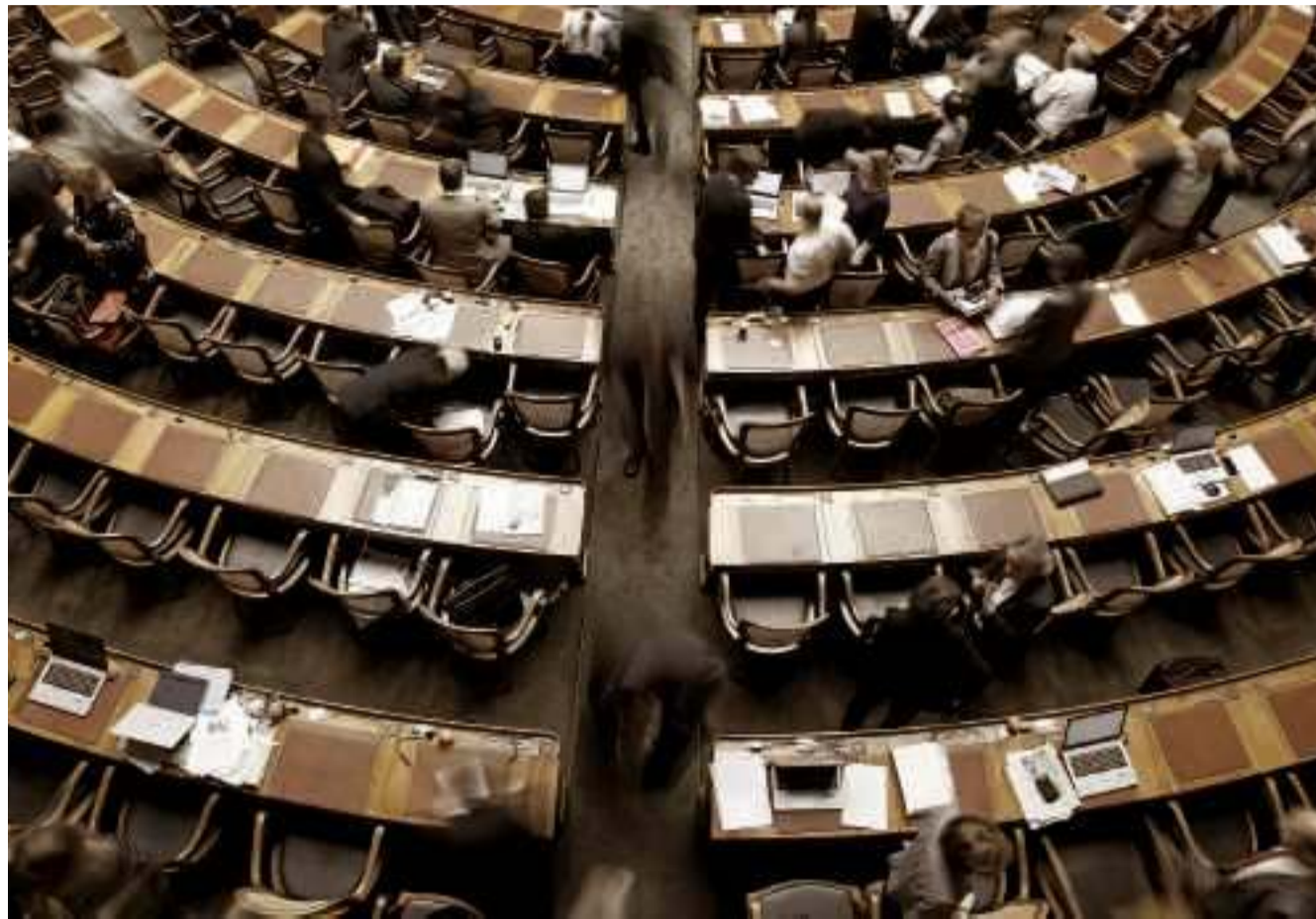
Wer in den Nationalratssaal schaut, sieht dort immer mehr Profi- statt Milizabgeordnete.

Demgegenüber ist eine Berufsgattung im Parlament stärker gewachsen als jede