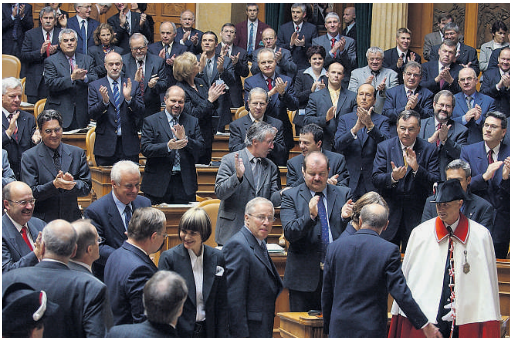
Bundeshaus, 10. Dezember 2003. Applaus für den neuen Bundesrat Christoph Blocher (Bildmitte) und seine Amtskollegen nach der Vereidigung.

Die erste Bundesratswahl, die nach dem Ende der Zauberformel stattfand, stellte gleichsam die Ausnahme von der Regel dar. Als 2006 Joseph Deiss demissionierte, leckte die CVP immer noch ihre Wunden. Doris Leuthard, die nach dem Debakel von 2003 das Ruder der Partei übernommen hatte, stand bereit. Niemand mochte die in der Regierung dezimierten Christlichdemokraten erneut auf die Probe stellen, zumal Leuthard auch parteiintern unbestritten war. Zum Eklat kam es 2007. Die Auffassung, Christoph Blocher müsse den