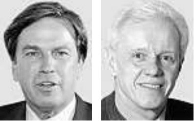
Franz Voves Landeshauptmann

Doch die Idylle trägt. In der Gemeinde, die nur 760 Einwohner zählt, herrscht Unmut, der sich bei der Nationalratswahl von Ende September in einem politischen Erdbeben entladen hat. Die zuvor dominierenden Sozialdemokraten (SPÖ) stürzten um über 30 Prozentpunkte auf knapp 7 Prozent Stimmenanteil ab. Nicht viel besser erging es der bürgerlichen Volkspartei (ÖVP), sie verlor gut 21 Prozentpunkte und kam noch auf 11 Prozent. Nirgends in Österreich verloren die beiden Traditionsparteien zusammen mehr Stimmanteile. Der