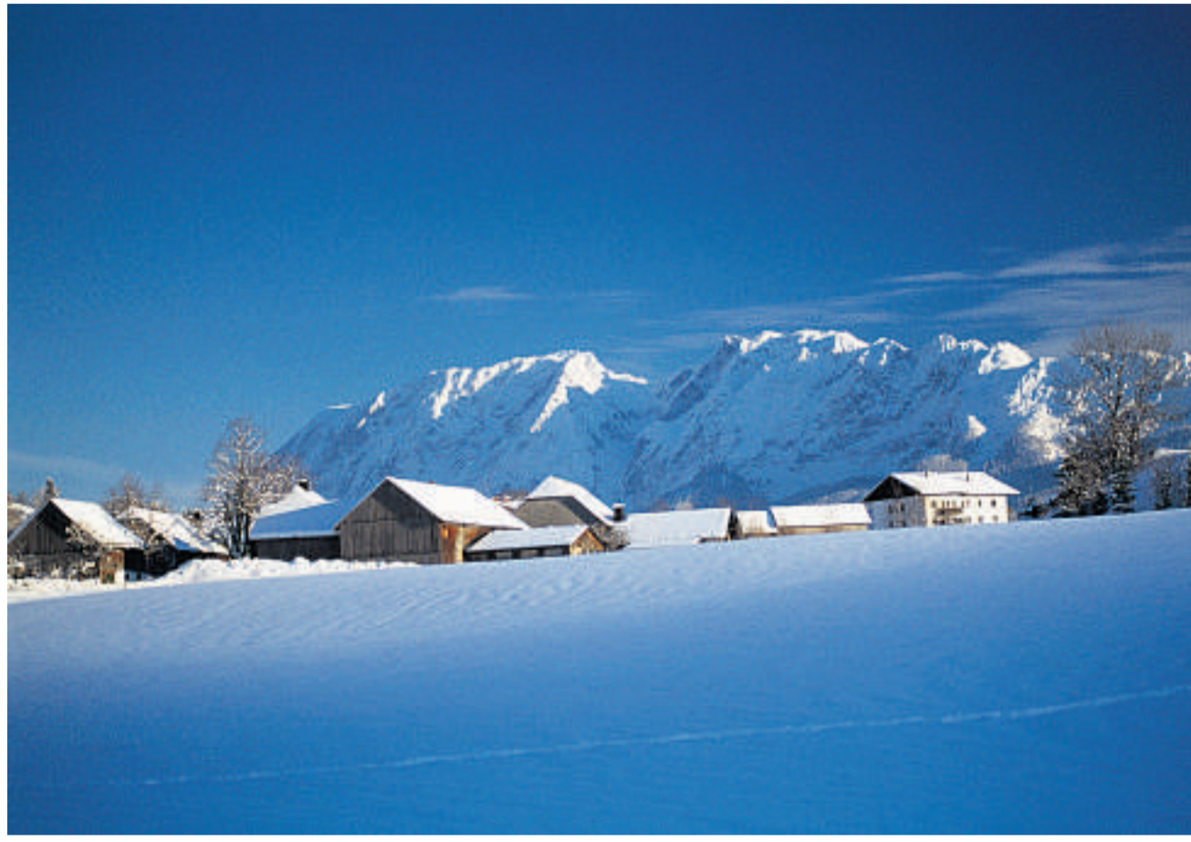
Im idyllischen Dorf Pichl-Kainisch haben die Nationalratswahlen ein politisches Erdbeben ausgelöst.