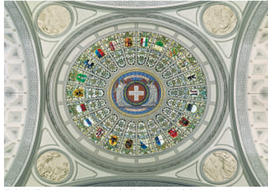
Föderale Harmonie – wenigstens in der Kuppel des Bundeshauses.